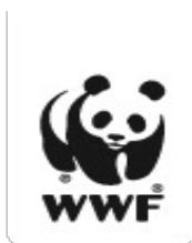
Isabelle AUTISSIER Présidente de WWF France